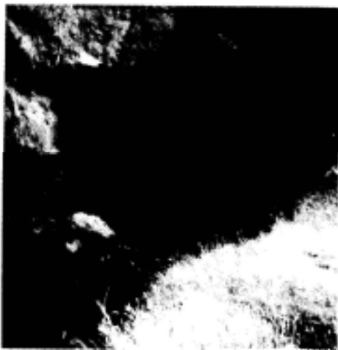
Un o'r amryw geudyllau yn Nant-y-Gadwen

Yn Rhagfyr 1828 rhoddodd Arglwydd Newborough brydles blwyddyn i ganiatau mwyno ym Mhenarfynydd ond deallir erbyn heddiw na chafwyd mwynau ar dir y fferm. Cafwyd prydles un flynedd