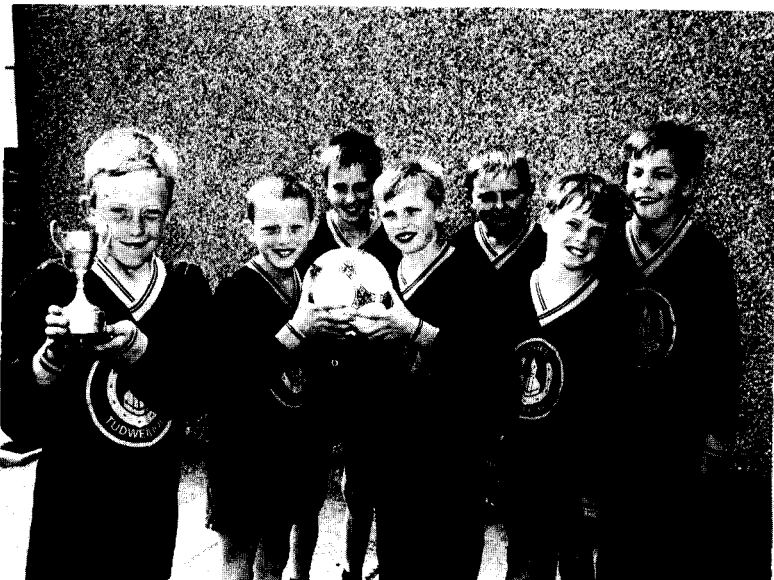
Llongyfarchiadau i ddisgyblion Ysgol Tudweiliog a ddaeth yn ail yn y Gystadleuaeth Pêl-droed pum-bob-ochr ysgolion dalgylch Botwnnog.