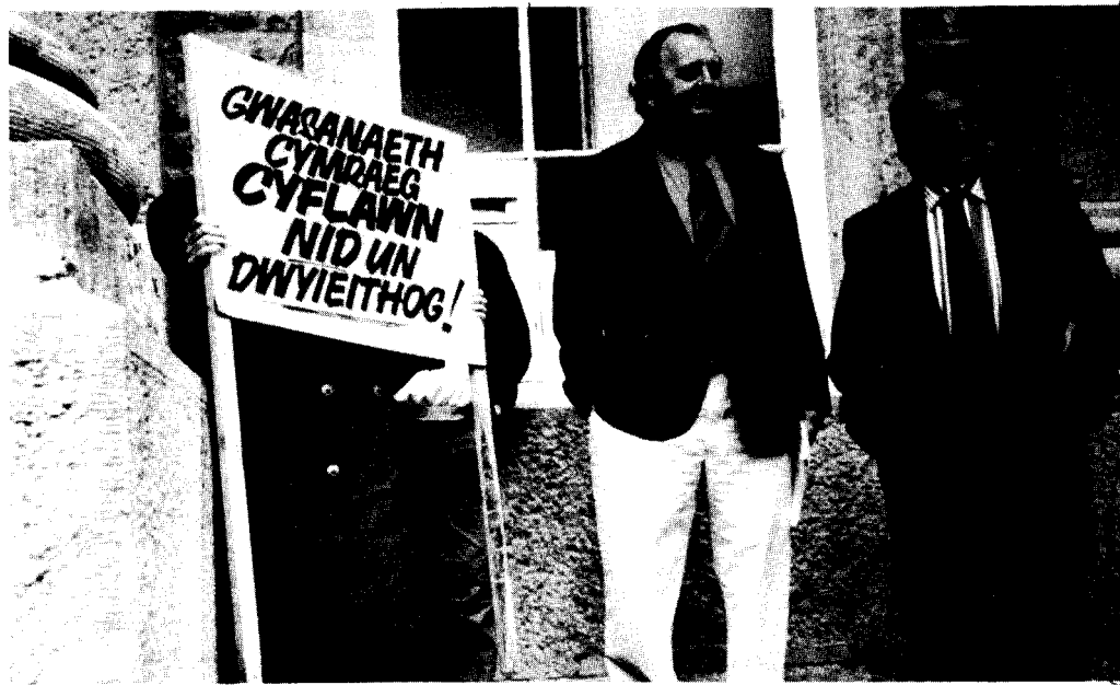
Geraint y tu allan i Lys Caernarfon, 8 Medi 1999

Beth, mewn difrif calon, sy'n cymhell Cymry 'parchus' canol oed a hŷn i wrthod talu am drwydded teledu a radio ac ymddangos gerbron meinciau ynadon i wynebu dirwyon a chostau trymion ac efallai garchar? Dagrau pethau yn y Gymru sydd ohoni ydi fod nifer cynyddol o bobl wedi cael hen lond bol ar Seisnigrwydd a safon rhaglenni, ac yn arbennig safon iaith radio a theledu Cymraeg.